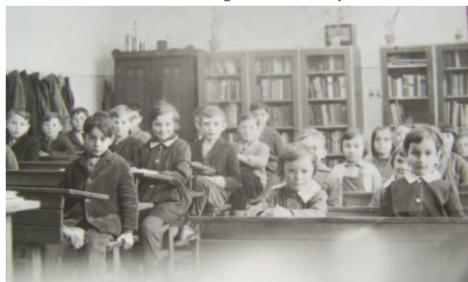
A tanterem, háttérben könyvtári szekrényekkel, 1960-as évek első fele