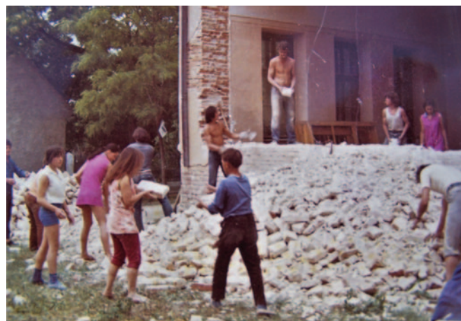
Toldalék építés az egykori iskolához társadalmi munkában, 1960-as évek második fele