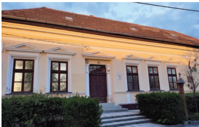
Mai Polgármesteri Hivatal

Polgármesteri Hivatal, némi belső átalakítás után valamennyi intézményének helyet adva.