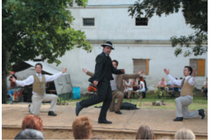
4 For Dance csoport bemutatója