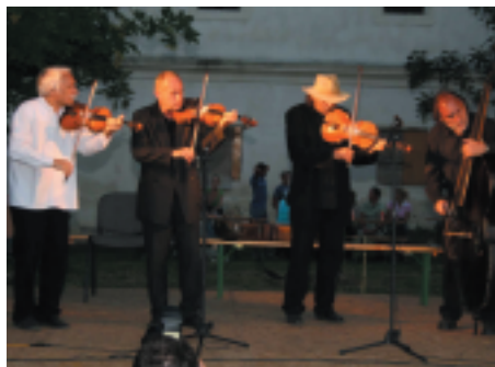
Muzsikás együttes koncertje