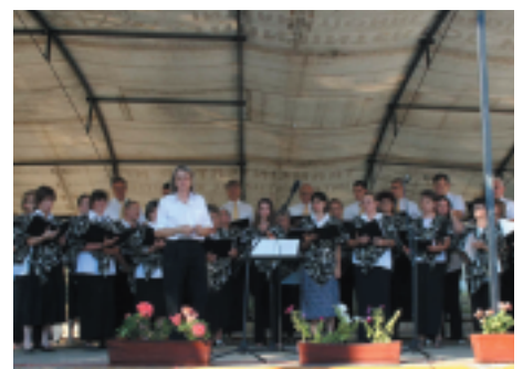
Perbáli Maklári József Kórus