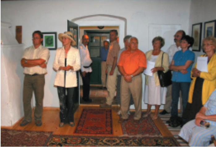
Kiállítás megnyitó a Pélbánián