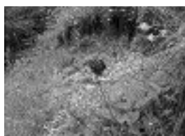
Gombos varjúköröm ( Phyteuma orbiculare )

A pusztai árvalányhaj között élő sárga virágú növény.