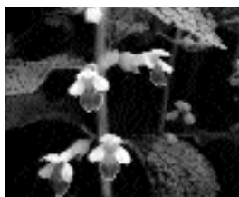
Déli méhfű ( Melittis melissophyllum )

A Budai-hegység jellegzetes növénye ez, amelynek levele a citromfűre emlékeztet.