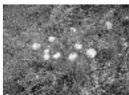
Magyar nyúlszapuka ( Anthylis vulnearia ssp. polyphylla)

A pusztai árvalányhaj között élő sárga virágú növény.