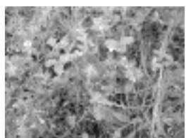
Piros gólyaorr ( Geranium sanguineum )

A Budai-hegység jellegzetes növénye ez, amelynek levele a citromfűre emlékeztet.