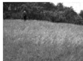
Pusztai árvalányhaj ( Stipa pennata )