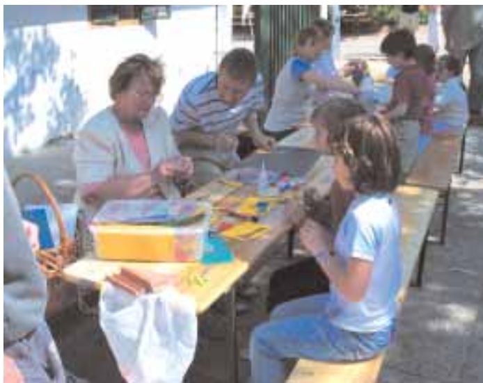
Kézműves foglalkozás gyermekeknek