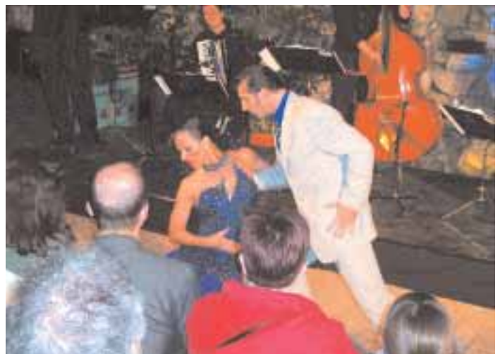
Kortárs zenei est Astor Piazzola műveiből a Quartett Esquale előadásában tangó táncbemutatóval