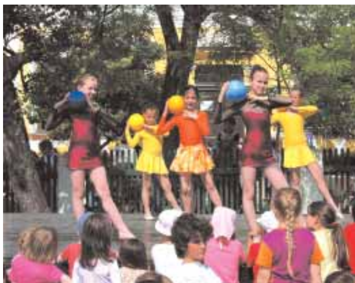
Ritmikus gimnasztika bemutató