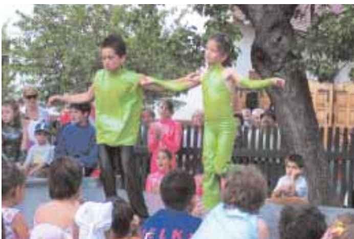
Telki művészeti gyerekcsoportok akrobatikus rock and roll...