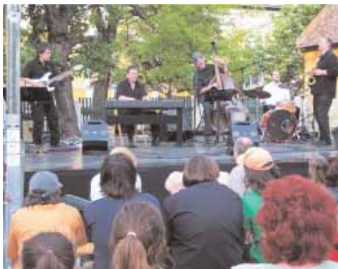
Happy Hours jazzkoncertje