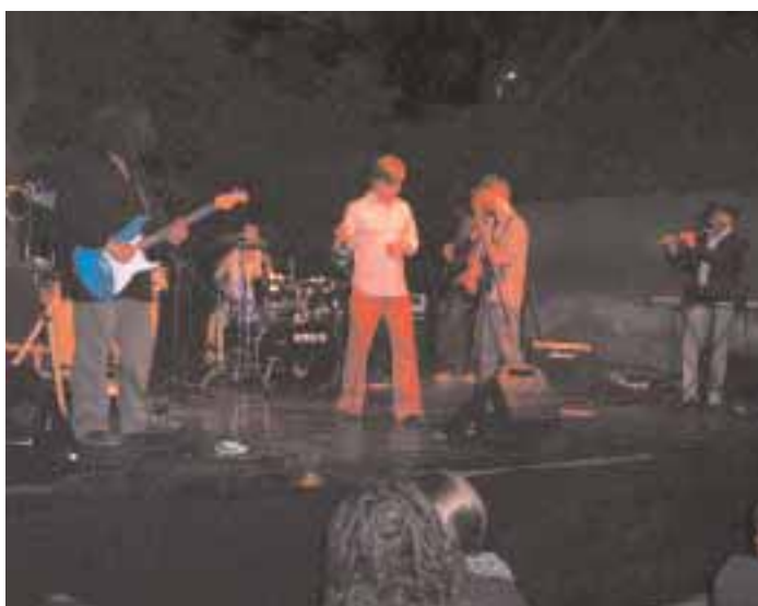
Azokon a napokon - rockkoncert zárta a fesztivált