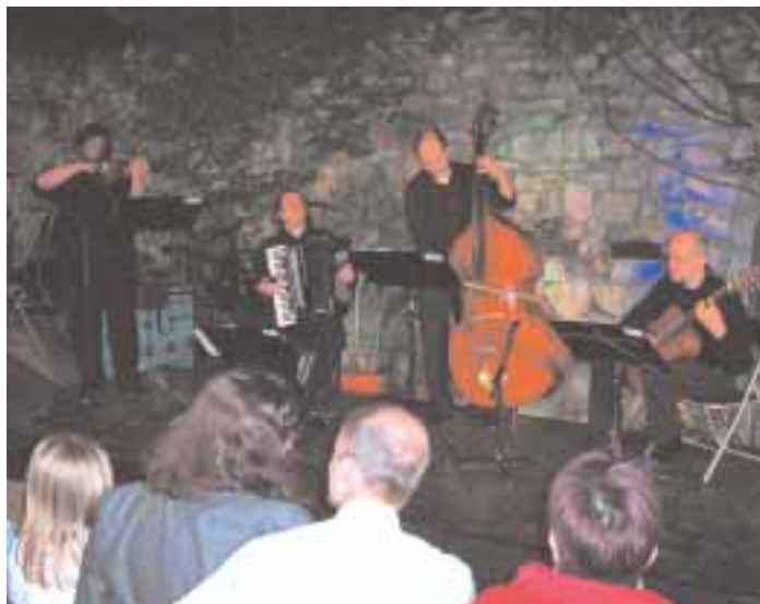
Quartett Esqualo kortárs zenei koncertje