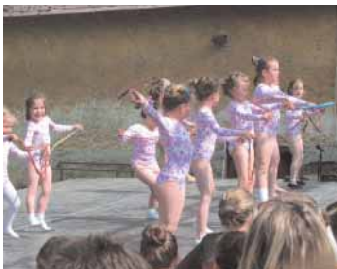
Ritmikus gimnasztika bemutató