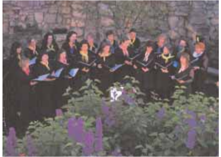
Bartók-Mozart est a Telki Nőkör...