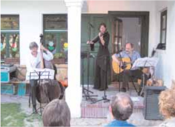
Telkír Trió koncertje a Bordás házban