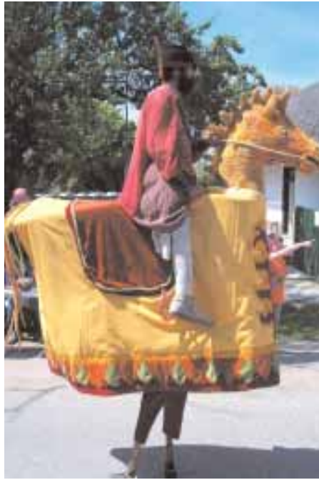
Gólyalábas bemutató, vásári komédia a Garabonciás Társulattal