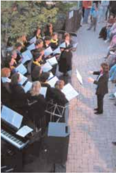
Telki Nőiakar a Művészek Házában