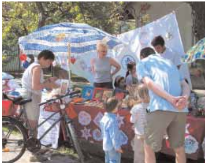
KEMŐ Pszichiátriai Intézet kézműves munkáinak vására