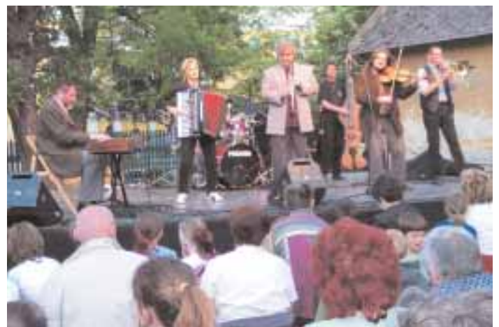
Budapest Klezmer Band