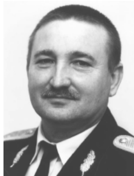
Dr. Ignác István dandártábornok

Szabadnapos rendőrök foglalkoztatására vannak példák a megye más településein, így Budaörsön és Szigetszentmiklóson is. Ennek mintájára kell kidolgoznia Telkinek a rendszert, aminek lényege, a rendőri jelenlét fokozása oly módon, hogy minden nap egy polgárőr egy szabadnapos rendőrrel alkosson járőrpárt. Ez a felállítás lényegesen hatékonyabb a jelenlegi, pusztán polgárőri jelenlét-