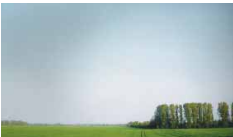
Bordás Flóra: Fák és a végtelen