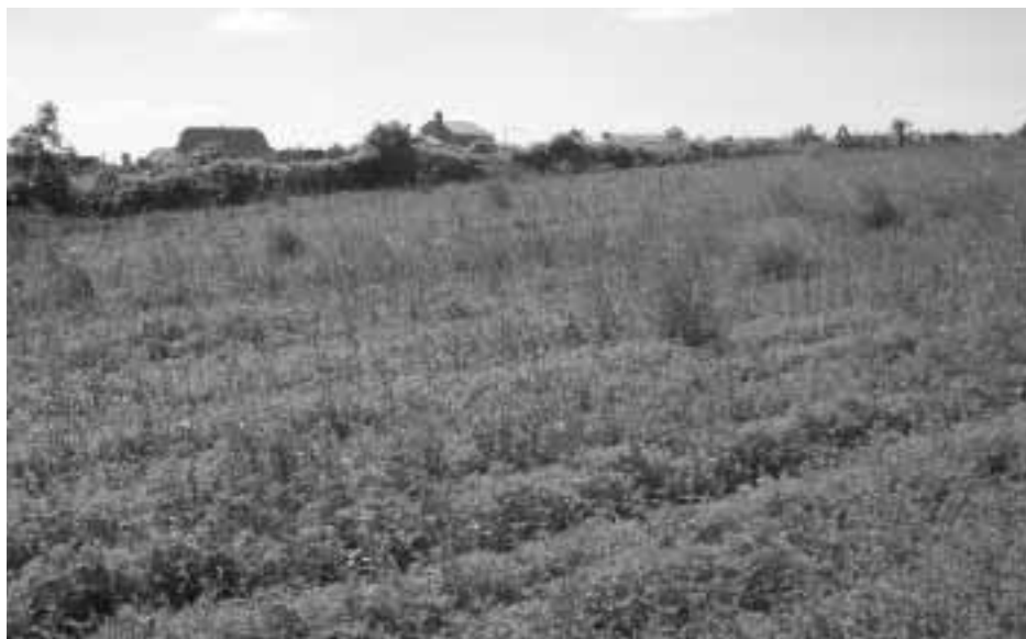
...és a fejlesztésre váró terület felől nézve

Az erdőn átvezető országút, mint egy hegyi patak kanyarog, míg a nyílt térre érve útját nem állja a duzzasztógát: Telki és Budajenő. Beléni könnyű, kiszállni annál nehezebb. És maradni?