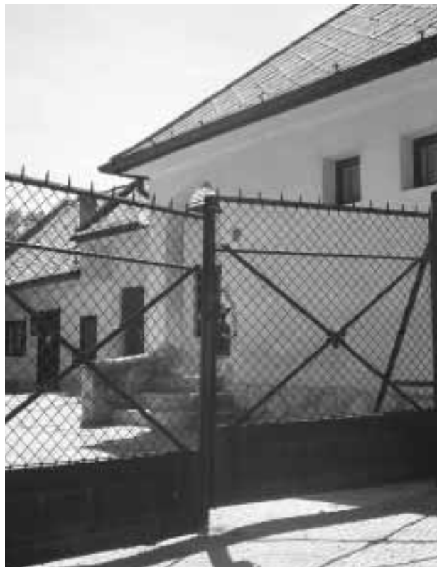
Az új egészségház átadása után végleg bezár a régi rendelő

A napról-napra növekvő lakosságszám és az országos átlagot örvendetesen meghaladó gyermekvállalási kedv az egészségügyi ellátás terén is új mennyiségi és minőségi igényeket teremtett. Ezek kielégítését, jól működő és korszerű egészségügyi szolgáltatások biztosításával, kiemelten fontos feladatának tekintti az önkormányzat. A 2002. őszi hivatalba lépett képviselőtestület már az egészségfejlesztési koncepciójának kialakítása során számolt az egészségügyi alapellátásban megnövekvő feladatokkal. Bízunk benne, hogy az új ellátási körzetek, a szabad orvosválasztás lehetőségének megteremtése, valamint a hamarosan meg-