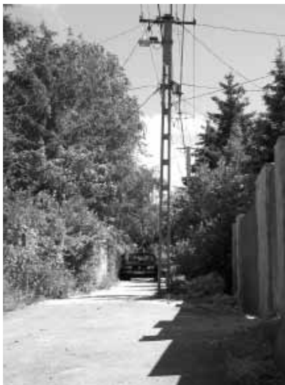
Villanyoszlop az út közepén