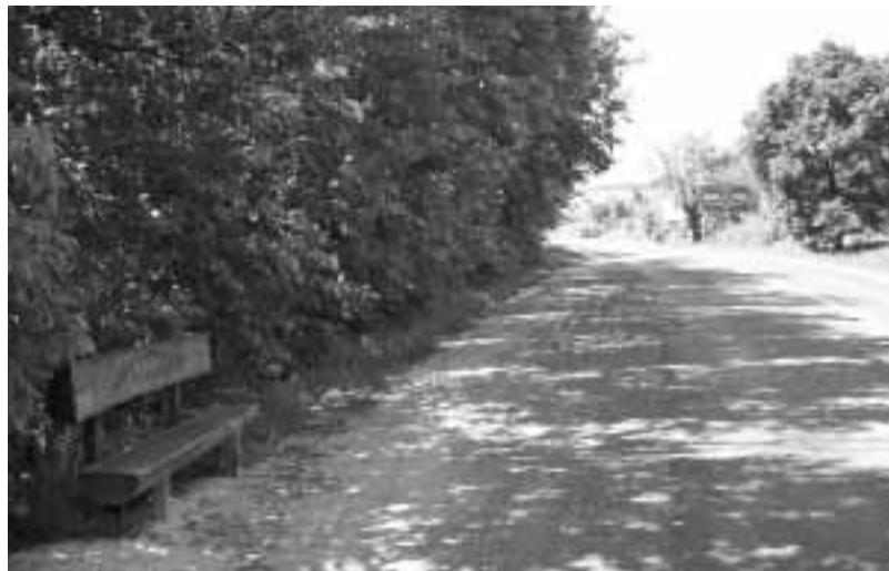
Buszmegállóhoz nem vezet járda és nincs közvilágítás sem.