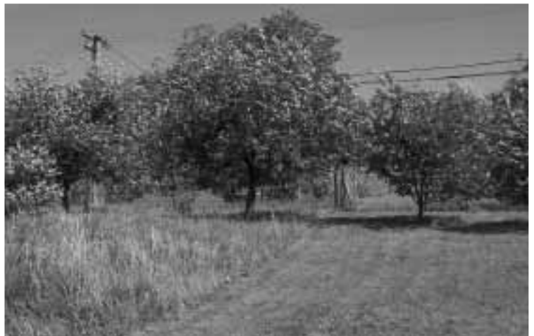
Van aki nyírja, van aki nem