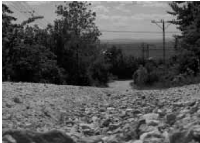
A lezúduló csapadékvíz árkot váj a murvába

Egy hozzászóló nehezményezte, hogy a polgármesternek címzett, számos üdülőtelepi lakos által aláírt levélre a mai napig nem kaptak választ. Varga Mihály reagálásában jelezte, hogy a levél teljes terjedelmében megjelent a Telki Naplóban, az ő válaszával együtt (Telki Napló 2005. februári szám, 8. oldal – a Szerk.).