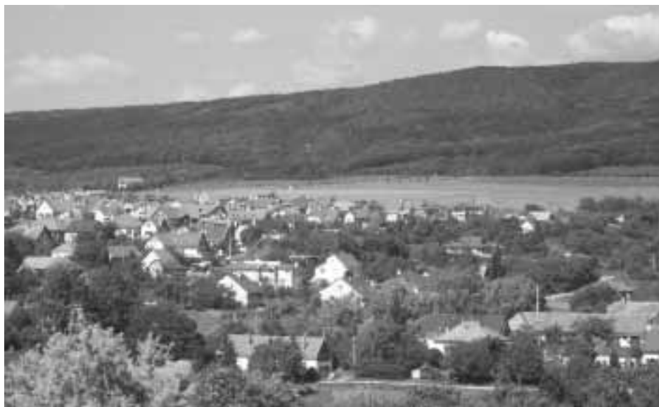
Budajenő látképe ma a Hilltopról...