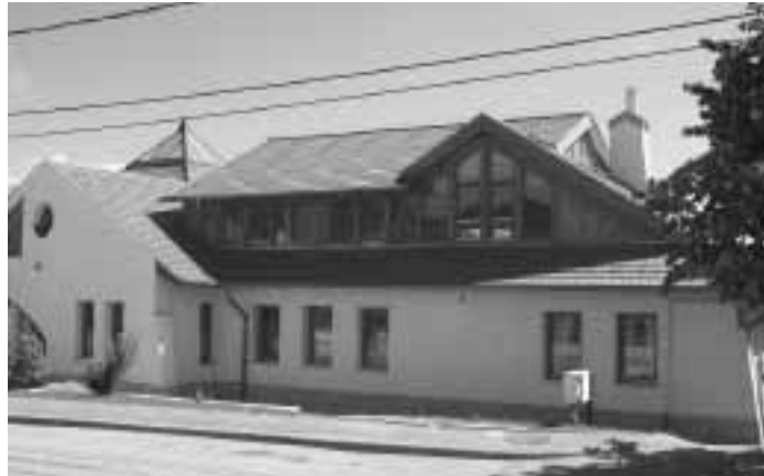
Tetőtérbeépítés után. Merre tovább?

T.N.: Lehet, hogy én látom át rosszul a kérdést, de ezek szerint Telkinek nem érdeke, hogy újabb óvodai férőhelyeket hozzon létre, hiszen annyi gyermeket fel tud venni, amennyit tényleg el kell helyezni, a környék-