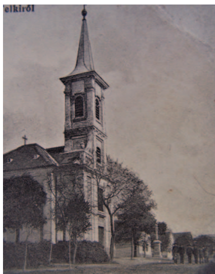
A templom az 1800-as évek végén