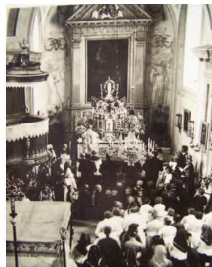
Ünnepi Istentisztelet az 1930-es években