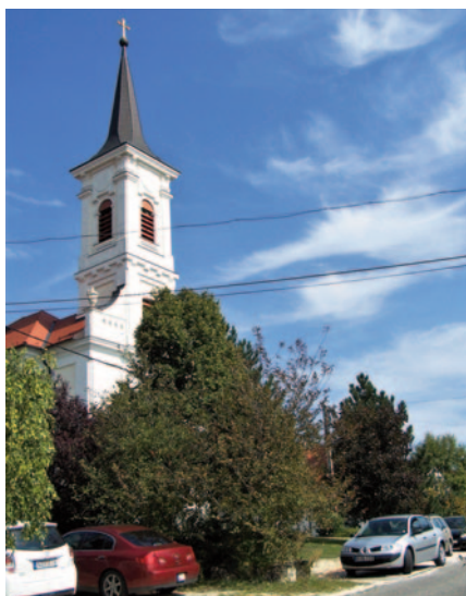
A templom manapság ugyanonnan