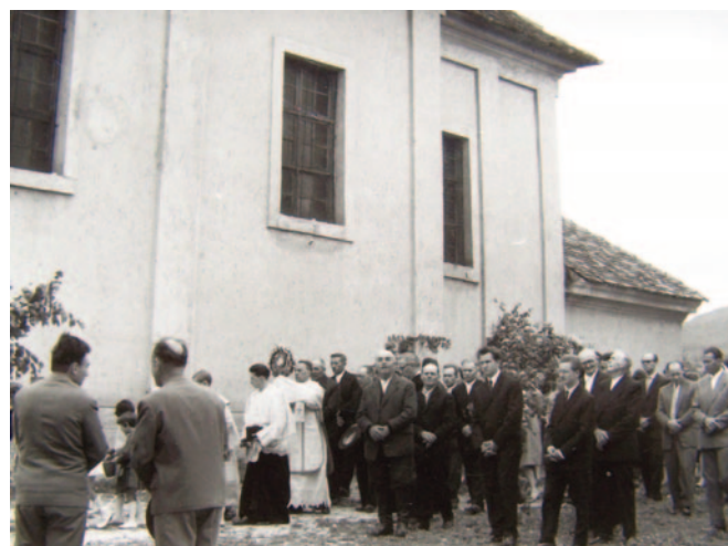
Úrnapi körmenet az 1950-es években